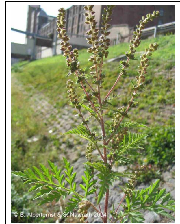
Abb. 1: A. artemisiifolia , Hafen Mannheim 10/2004

Die Beifuß-Ambrosie ( Ambrosia artemisiifolia ) und die habituell ähnliche Stauden-Ambrosie ( A. coronopifolia ) (vgl. Abb. 1, 2) sind in Nordamerika beheimatet und wurden von hier unbeabsichtigt nach Deutschland gebracht. Beide Arten, besonders aber A. artemisiifolia , sind in den letzten Jahren zunehmend in das Interesse der Wissenschaft gerückt, weil sie schwere Pollenallergien beim Menschen hervorrufen können.